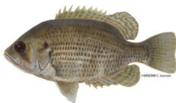
Saum toj: A Rock Bass.

Muaj 73 hom ntses tau muab ua qauv los ntawm tus dej Blue Earth Rever txij li thaum sij hawm Cox los txog rau tam sim no. Ntawm 73 hom no, tau kwv yees li 12 hom, xws li Rock Bass thiab Rainbow Darter, tau tu noob tag mus hauv dej lawm. Tag nrho yog cuam tshuam nrog qhov dej ntshiab. Tus dej kuj tseem muaj ob hom ntses: Common Carp thiab Yellow Bass. Cox tsis tau muab yam qauv carp nyob hauv xyoo 1890s; hauv kev soj ntsuam kev nuv ntses ntawm MPCA nyob rau xyoo 2017, yam Common Carp ua rau pom tias muaj li 56% ntawm cov ntses hauv dej los ntawm k