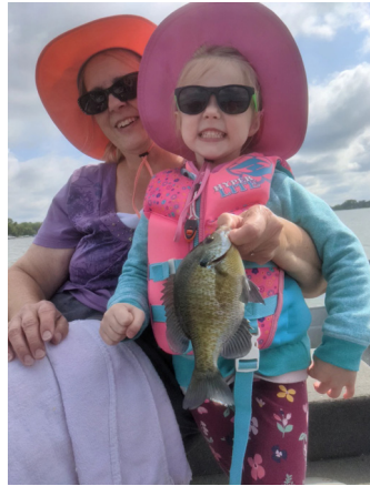
rau yawg thiab tus ntshais ua kev nco.

Lub suab qv ntawm kev lom zem yuav tau hnov los ntawm ntau tus neeg nuv ntses uas nyob ib ncig ntawm peb. Luag nyav ntawm lawv lub ntsej muag tau hais qhia txhua yam. Lawv tau muaj lub sij hawm zoo! Peb kuj tseem tau hais kom peb cov xeeb ntawv muaj kev koom nrog kev tu ntses. Lawv yuav nqa ntses tawm ntawm lub thoob thiab nqa cov ntses los rau kuv, yog li ntawd kuv thiab li yuav tau cov nqaij (filet) ntses. Kuv ntseeg tias lawv tsim nyog yuav muaj kev koom tes nyob rau cov txheeb txheem tag nrho. Pog yuav koom nrog lawv ua ntses noj. Lawv nyiam noj ntses uas tsim nrog kev hlub. rau ntawm kev pib cov me nyuam yaus. Mus rau pas dej nyob ze ntawm tsev, koj tsis hmoo uas tau muaj hnuv tso ntses 100 tus, coob leej paub tias kev mus ncig ua si yuav siv sij hawm ntev li 15 feeb los sis peb teev. Tsis txhob